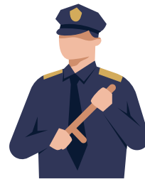
Monopolio de la Fuerza