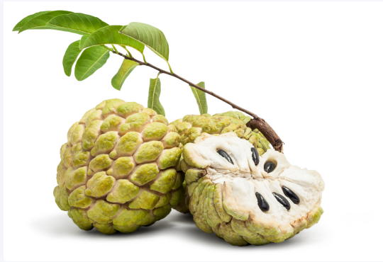
ช่วยงา Custard apple