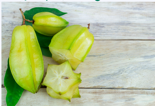
มะเฟือง star fruit