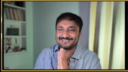
Sir Anand Kumar Founder Super 30