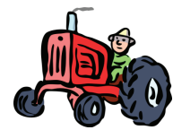
tr - traktor