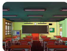
aul a /awla/