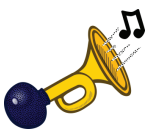
kl - klakson