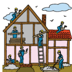
str - konstruksi