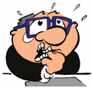
kh - khawatir

kh ng ny sy sp st pr pl kr kl br tr str skr ngg