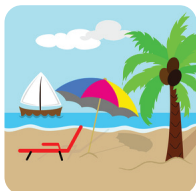
pant a i /pantay/