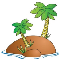
pul a u /pulaw/