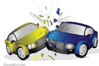
br - tabrak