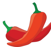
cab a i /cabay/