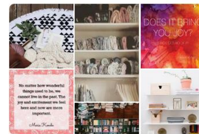
Marie Kondo's Sim... 핀 191개