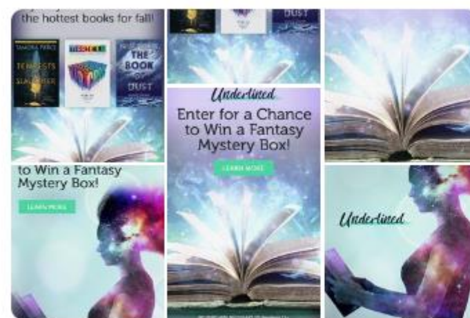
Underlined Fall Fan... 핀 6개