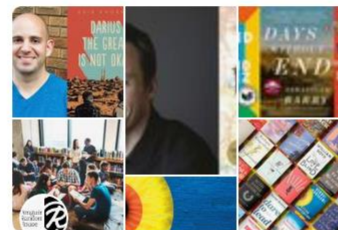
The Beauty of Books 핀 292개