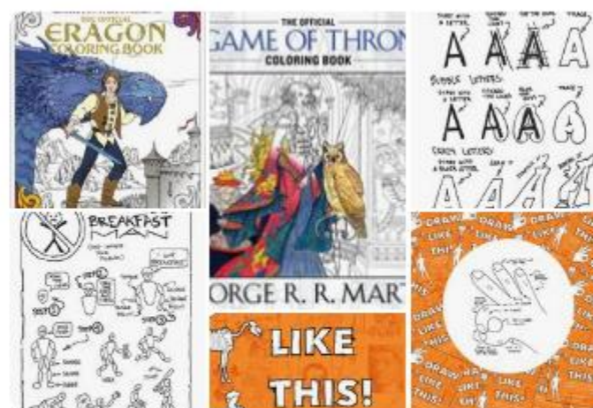
Coloring and Creati... 핀 7개