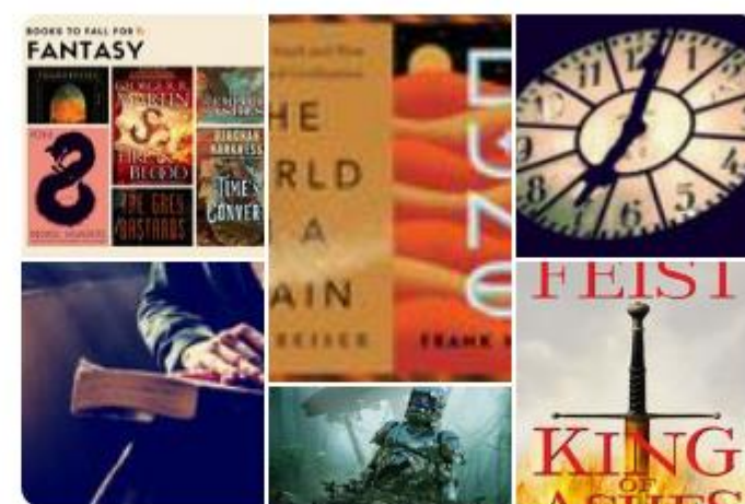
Unbound Worlds 핀 1,003개