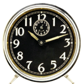
el reloj the clock