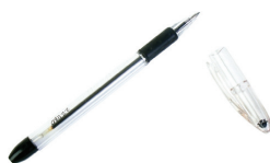
la pluma the pen