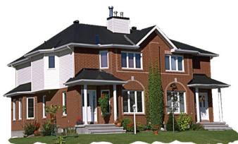
la casa the house