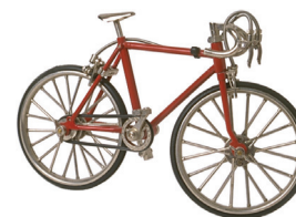
la bicicleta the bicycle