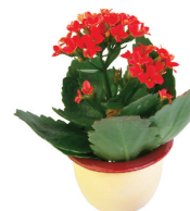
las flores the flowers