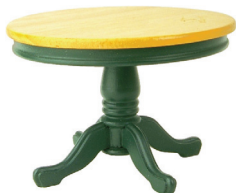
la mesa the table