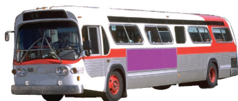
el autobús the bus