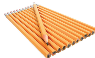
el lápiz the pencil