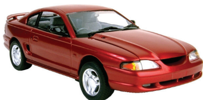
el auto the car