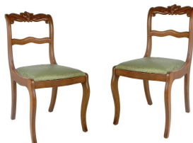
las sillas the chairs