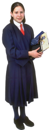
el, la profesora el, la maestra the teacher