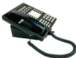
el teléfono the telephone