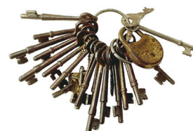
las llaves the keys