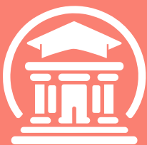
Universidad de las Naciones Unidas (UNU)