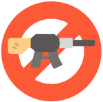
Desarme y seguridad internacional