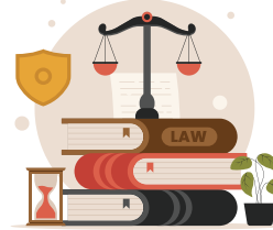
Corte Internacional de Justicia y el consejo Económico y social