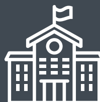
Instituto de Investigación de las Naciones Unidas para el Desarrollo Social (UNRISD)