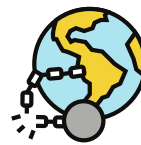
Política especial y descolonización