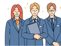
Asuntos administrativos y presupuestarios