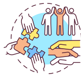
Asuntos sociales humanitarios y culturales