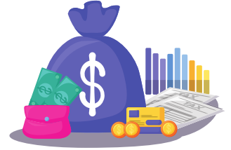
Consejo económico y social con la Asamblea General