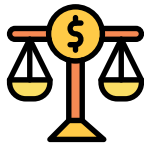
Asuntos económicos y financieros