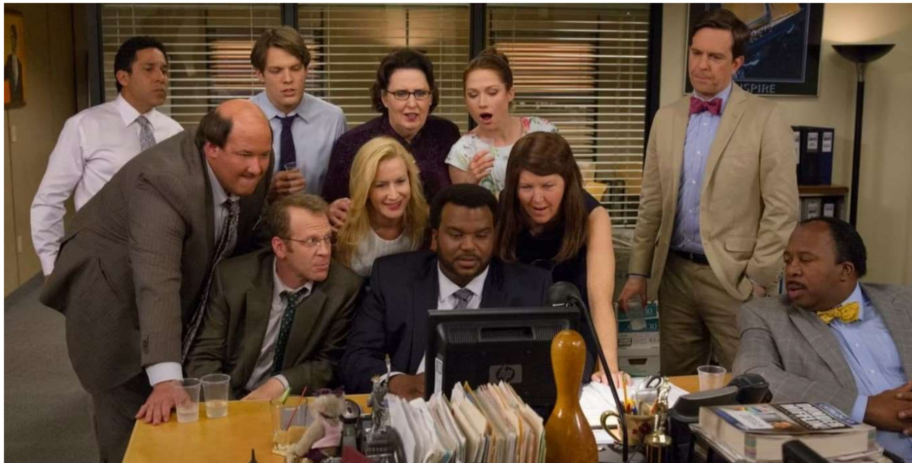
Кадр из сериала «Офис»